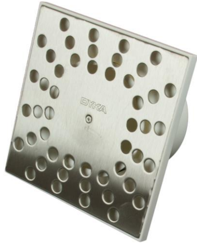
Doucheput met RVS rooster 15 cm x 15 cm